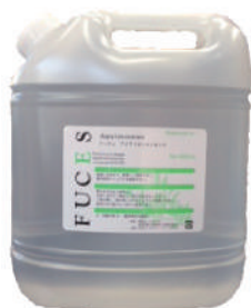
アクアイオンエッセンス